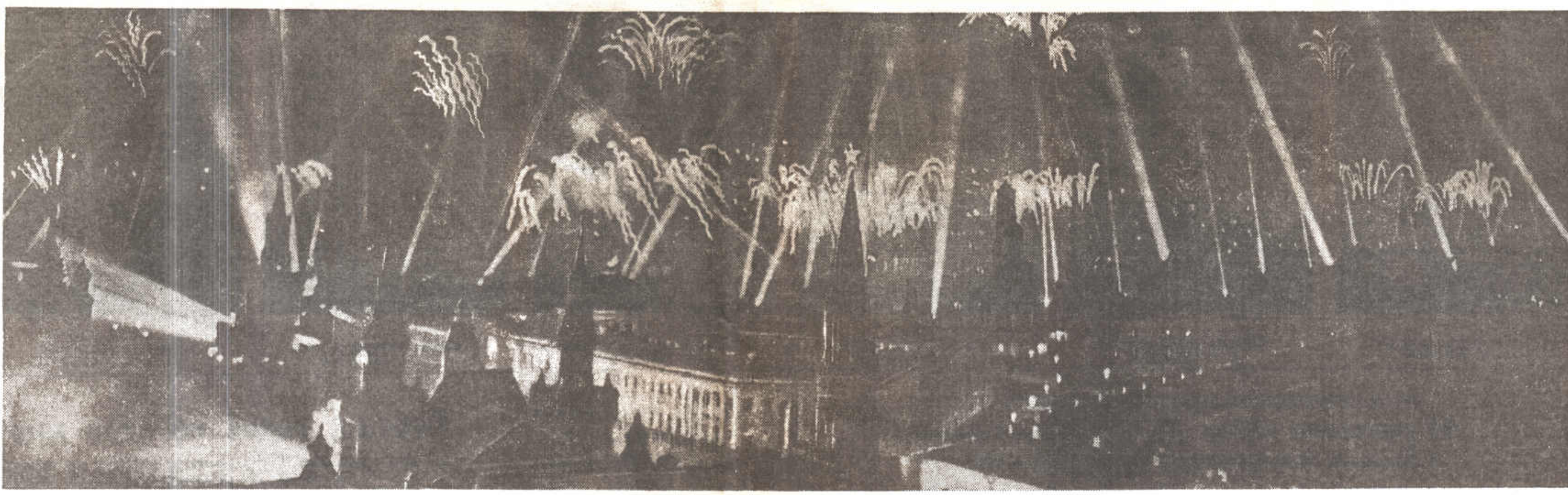
ПРАЗДНИК ПОБЕДЫ. Москва в 22 часа 9 мая.

«Слава нашей героической Красной Армии, отстоявшей независимость нашей Родины и завоевавшей победу над врагом! Слава нашему великому народу, народу-победителю! Вечная слава героям, павшим в боях с врагом и отдавшим свою жизнь за свободу и счастье нашего народа!» И. СТАЛИН.